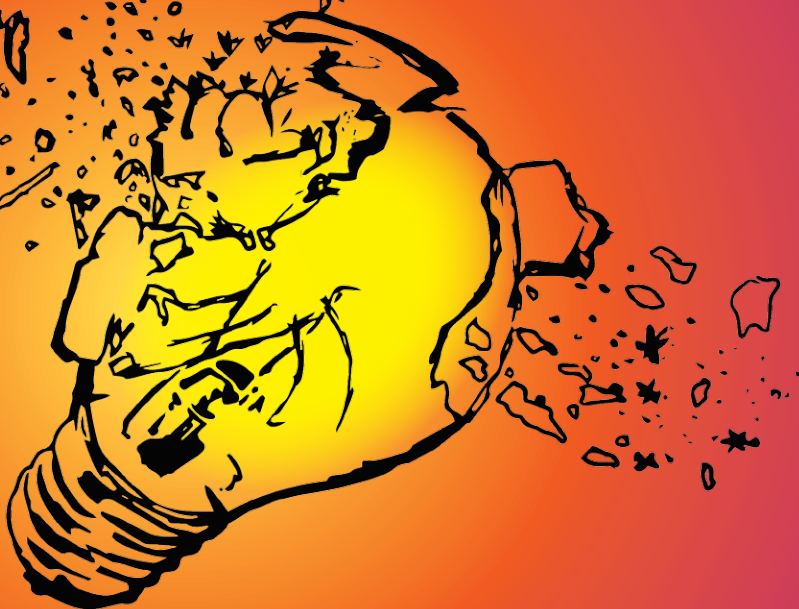
Immagine ideata e realizzata dai ragazzi del Laboratorio MAKE YOUR EXPERIENCE a cura di Riccardo Sivelli

2018 - PRIMA EDIZIONE antichi saperi e nuovi orizzonti www.boomcantierecreativo.it